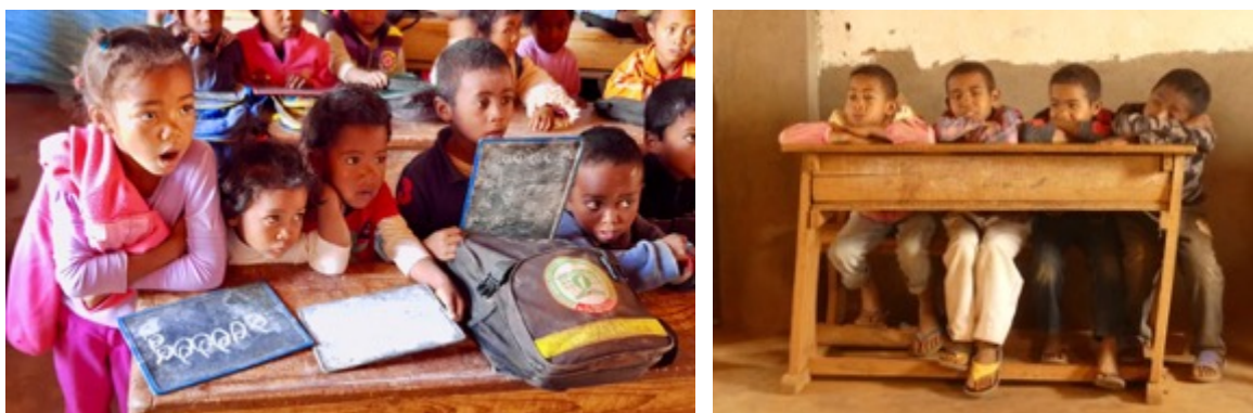
Figuur 4 : Vervanging van overvolle en kapotte schoolbanken

Zoals afgesproken met leraren en de directeur van de school bij ons laatste bezoek in november 2019, hebben we ermee ingestemd dat we de school zullen steunen met educatief materiaal, het vervanging van een deel van het schoolmeubilair en met name de aanschaf van een reeks van schoolbanken, waarvoor we in het budget van 2021 nog ruimte over hebben gelaten.