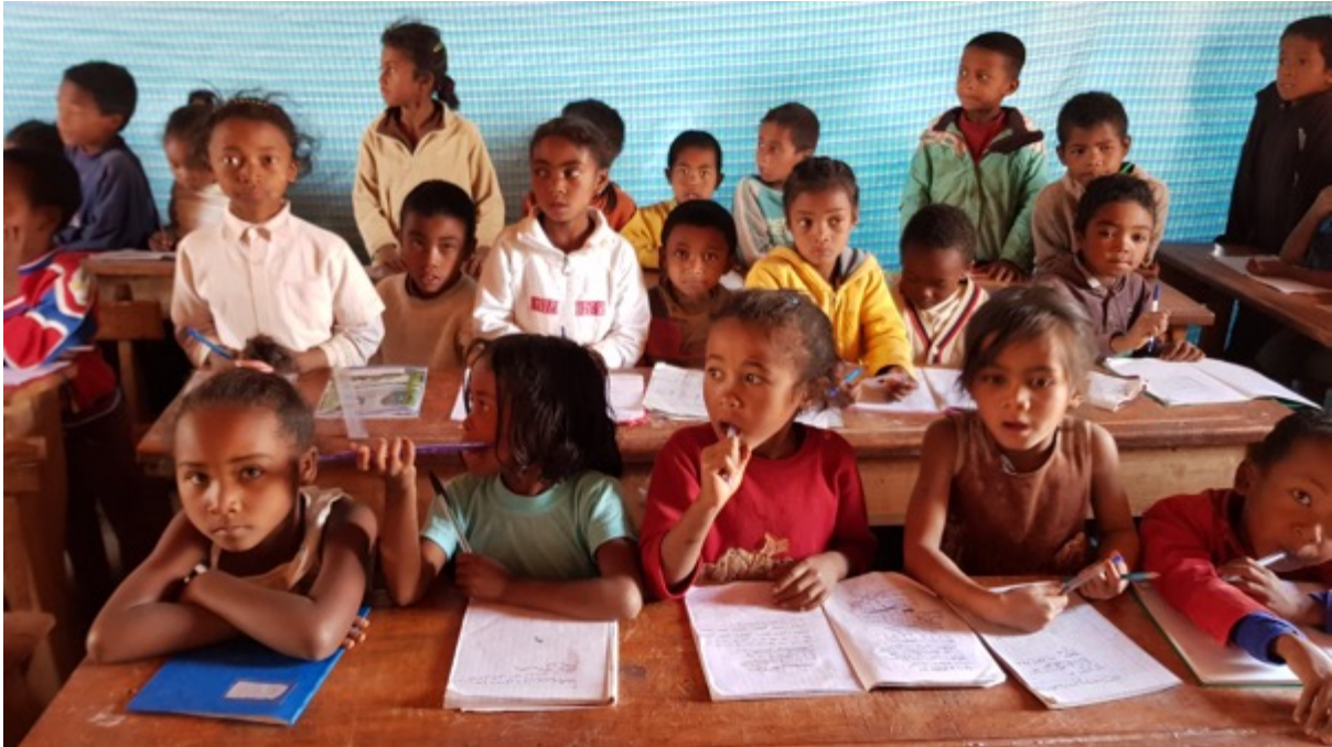
Figuur 1: Overvolle klassen op de Basisschool in Fiadanana