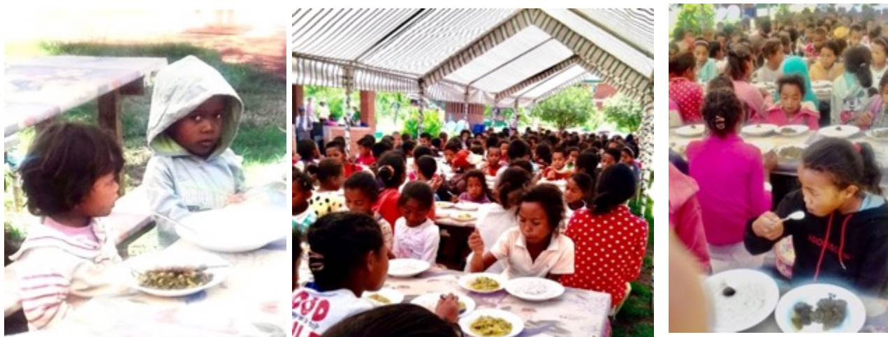
Figuur 3: 250 kinderen krijgen 4 maal per week een voedzame maaltijd met rijst groenten en bonen

Twee keer per week (maandag en donderdag) worden de ingrediënten op de plaatselijke markt in Antsirabe gekocht en vervoerd naar Fiadanana dat 13 km ten noorden van Antsirabe ligt. Een vast bedrag van MGA 21.000 komen ten laste van de kantine uitgaven.